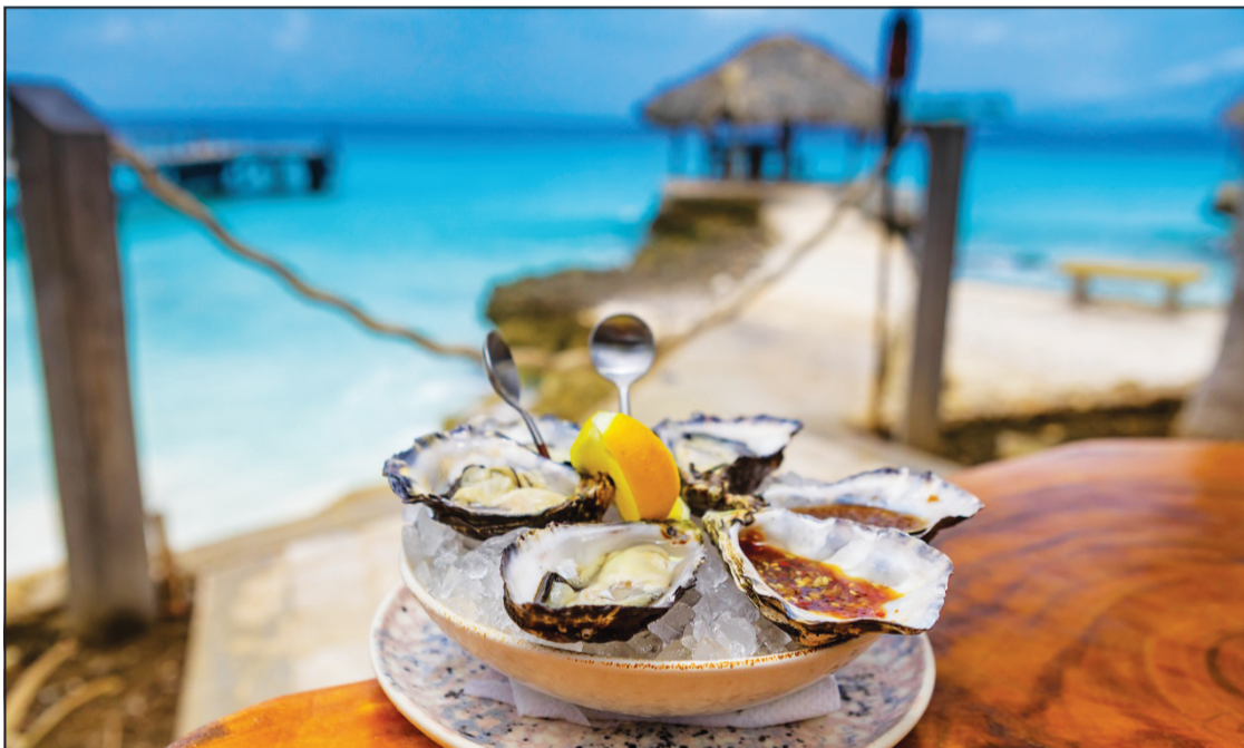
Uster na Brass Boer Restaurant

Mercera: “Bai lokal, pruf platonan lokal i bishitá Maiky Snack òf Divi Bar & Restaurant.”